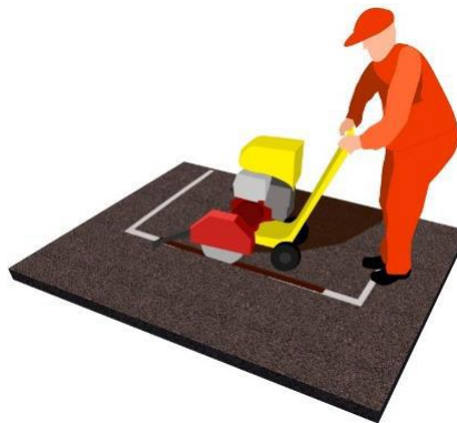
Figura 2 – Corte e remoção do revestimento asfáltico.

O material solto deverá ser removido com a utilização de pás, enxadas e carrinho de mão ou mini carregadeira e descartado cuidadosamente.