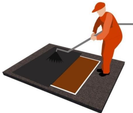
Figura 3 – Execução da pintura de ligação.

A emulsão deve ser diluída, no máximo, com 40% de água. A taxa de aplicação deverá situar-se em torno de 0,8 a 1,0 l/m 2 após a diluição com água.