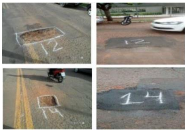
Figura 5 – Relatório fotográfico (Exemplo).