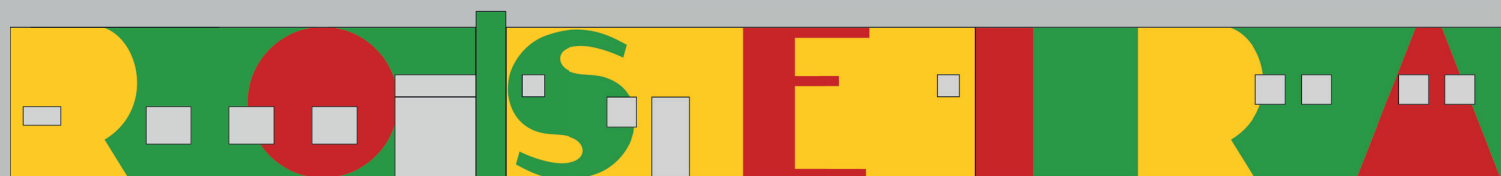
Definição das cores baseadas na bandeira e brasão municipal.