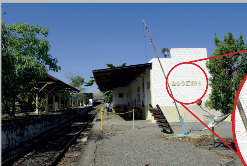
Letreiro da fachada antes da ampliação do prédio.